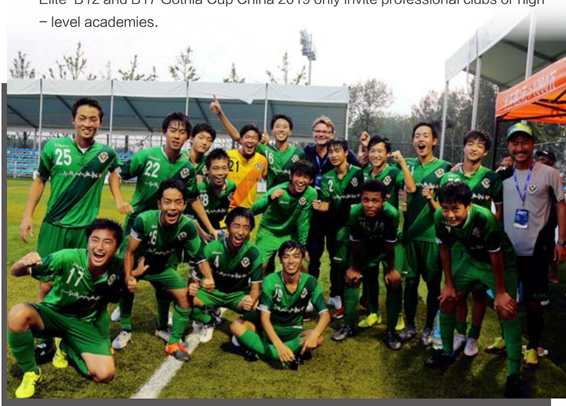
上图为2017年U18精英赛冠军日本东京绿茵队 Tokyo Verdan, Japan, the champion of Elite B18, 2017

2019年赛事将开设B12、B17精英赛，仅邀请职业队和高水平足球学院参加。 Elite B12 and B17 Gothia Cup China 2019 only invite professional clubs or high – level academies.